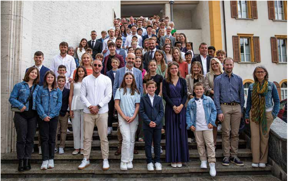
Firmung 27. Mai 2023 nachmittags