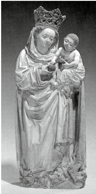
Die Muttergottes von Valeria, Sion

Könnte auch heute eine Beziehung zu Maria sinnvoll sein und dem Leben dienen?