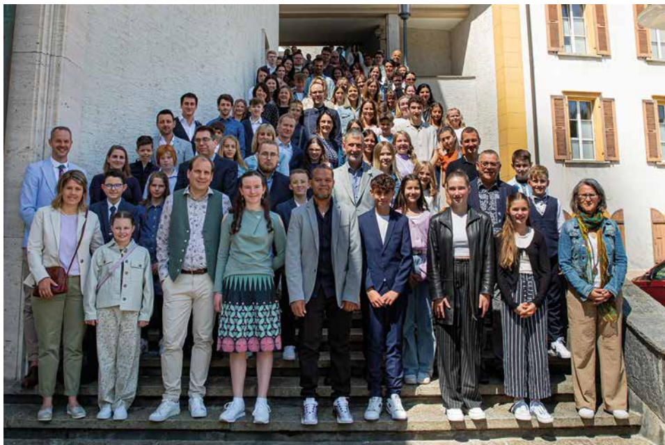
Firmung 27. Mai 2023 vormittags