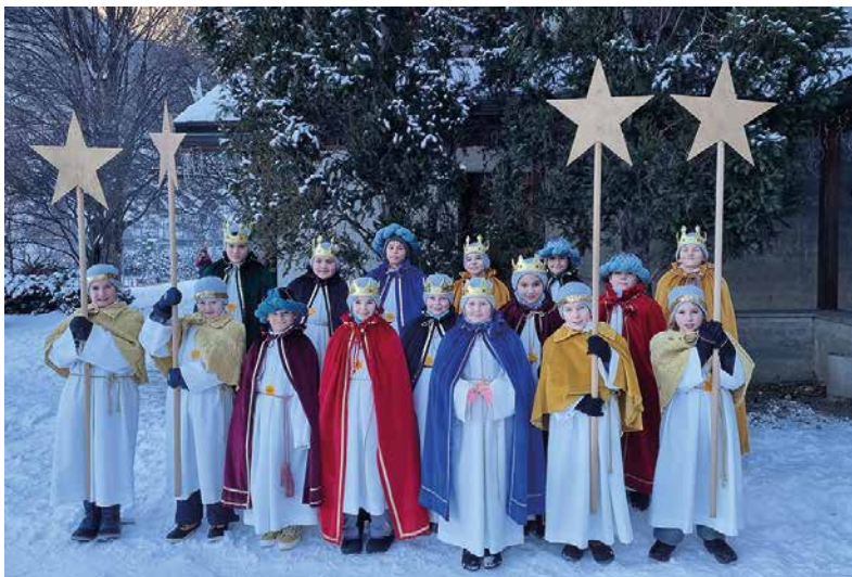
Stellvertretend für alle Sternsinger: hier ein Bild der Sternsinger von Eyholz 2022

Es konnte die stolze Summe von Fr. 4 500.- für das Hilfsprojekt gesammelt werden.