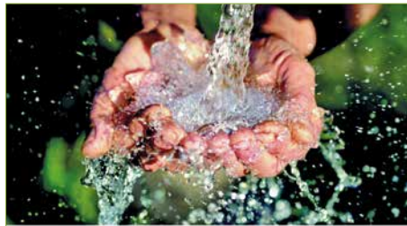
Auf zu neuen Energiequellen Fastenkalender 2022