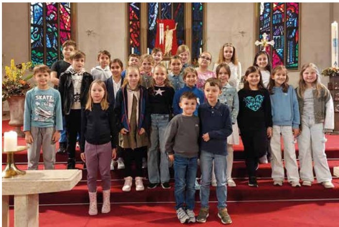
Tauferinnerung 16. Mai 2024 Schulhaus Sand