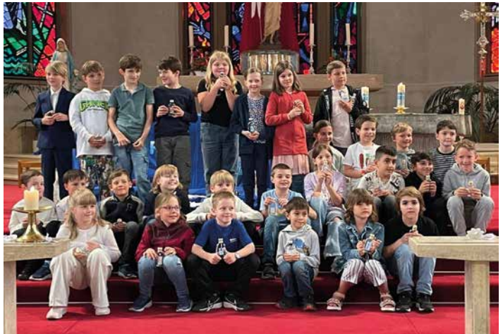
Tauferinnerung 13. Mai 2024 Schulhaus Baumgärten und Eyholz